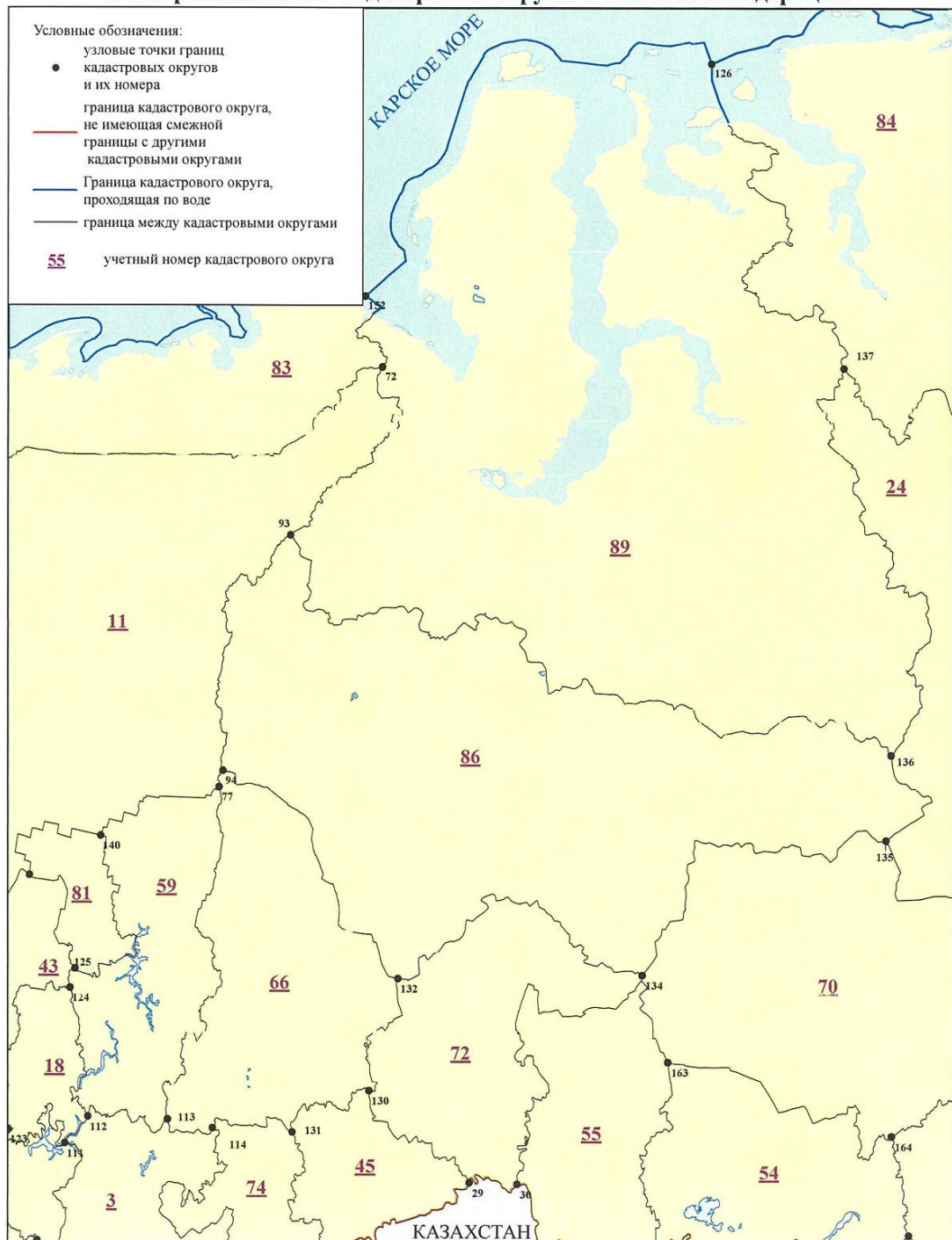
Схема расположения кадастровых округов Российской Федерации